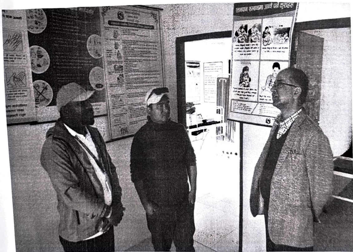
बडा कार्यालयमा रहेको स्वास्थ्य इकाईले दिने सेवाबारे जानकारी लिदै