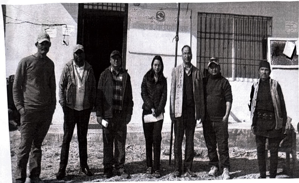
बडा कार्यालयका पदाधिकारी/कर्मचारीहरूसंगको सामुहिक तस्विर