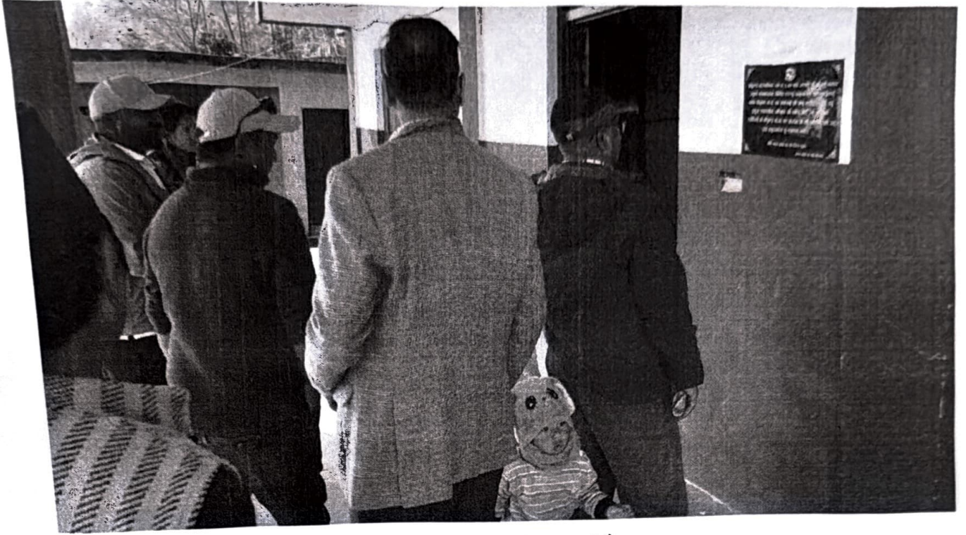
वडा कार्यालय भवनको अवलोकन गरिदै