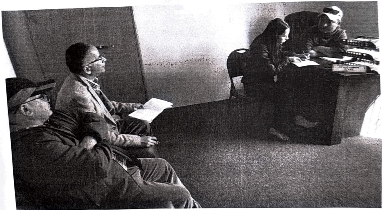
वडा कार्यालयबारे वडाअध्यक्ष र वडासचिवसँग जानकारी लिदै