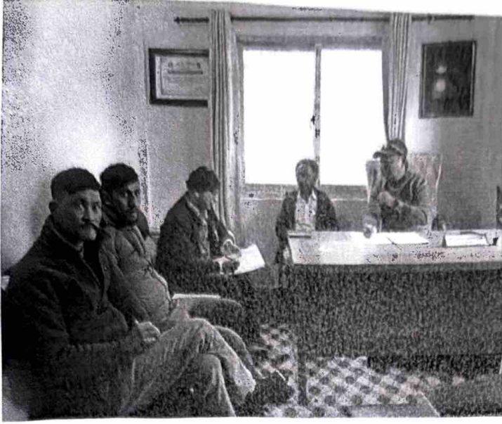
वडा स्तरीय अनुगमनका क्रममा वडा अध्यक्ष कर्मचारीसँग गरिएको छलफल