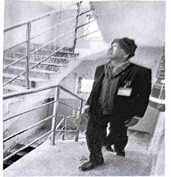
वडा कार्यालयको अनुगमन गर्नुहुँदै जिल्ला समन्वय अधिकारी