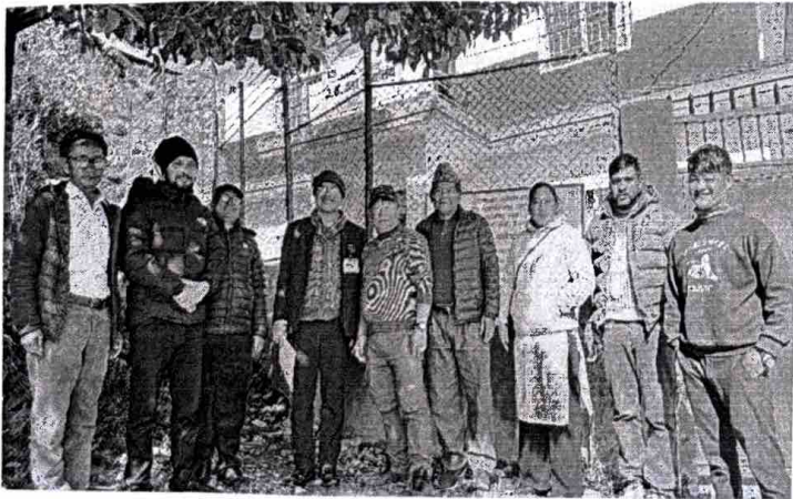
अनुगमन पश्चात् सामूहिक तस्बिर