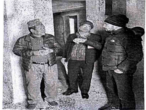
स्वास्थ्यको अलपत्र भवनको अनुगमन गर्दै