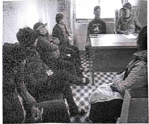
वडाकार्यालय बारे जानकारी लिने क्रममा