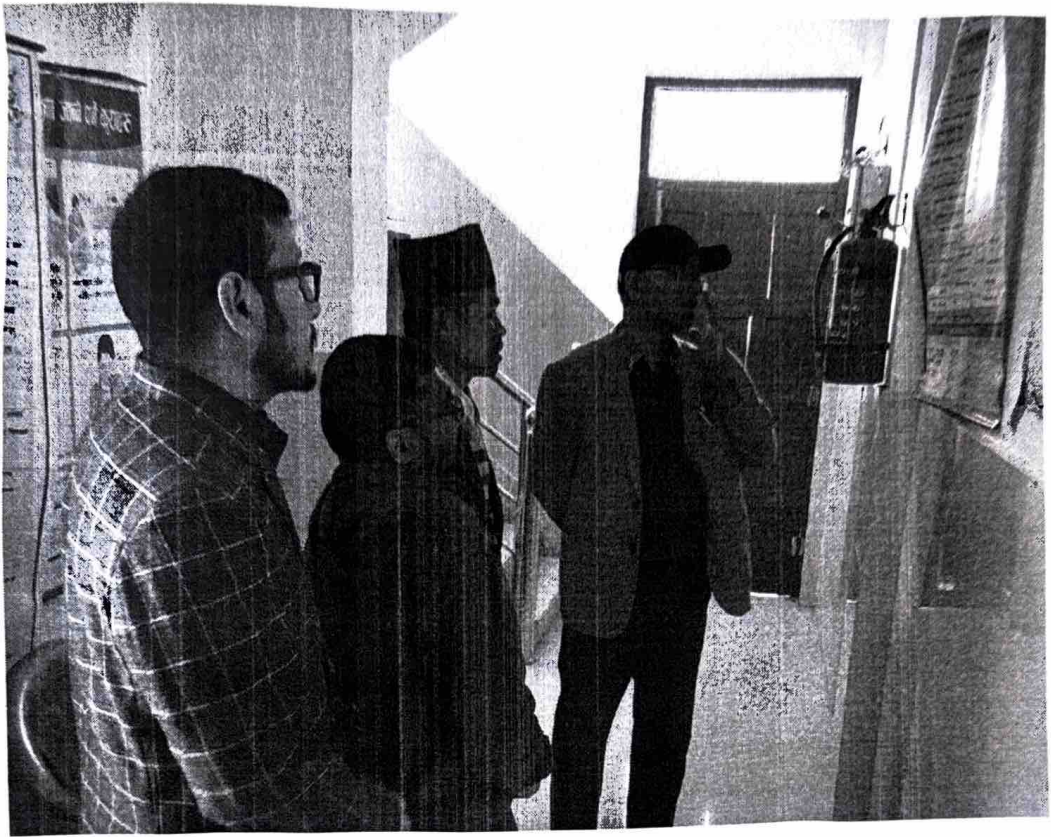
यासा स्वास्थ्य इकाईको निरक्षण गर्दै