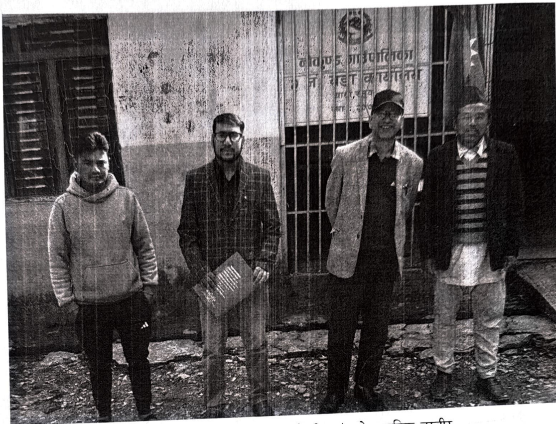
वडा कार्यालयाका पदाधिकारी तथा कर्मचारीहरूसंगको सामुहिक तस्बीर